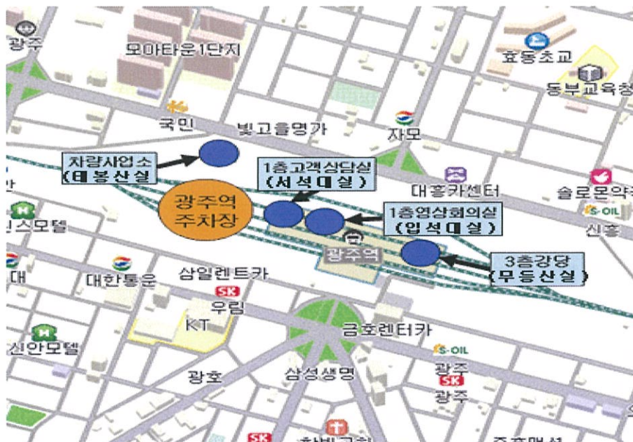
<광주 KTX역 회의실 약도>